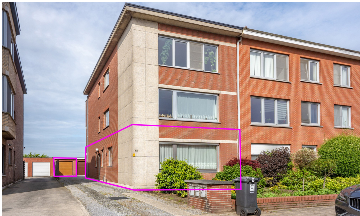
Kapellen | Appartement | € 229.000

Palmstraat 60, 2950 Kapellen | Referentie: 26062-3-Ac