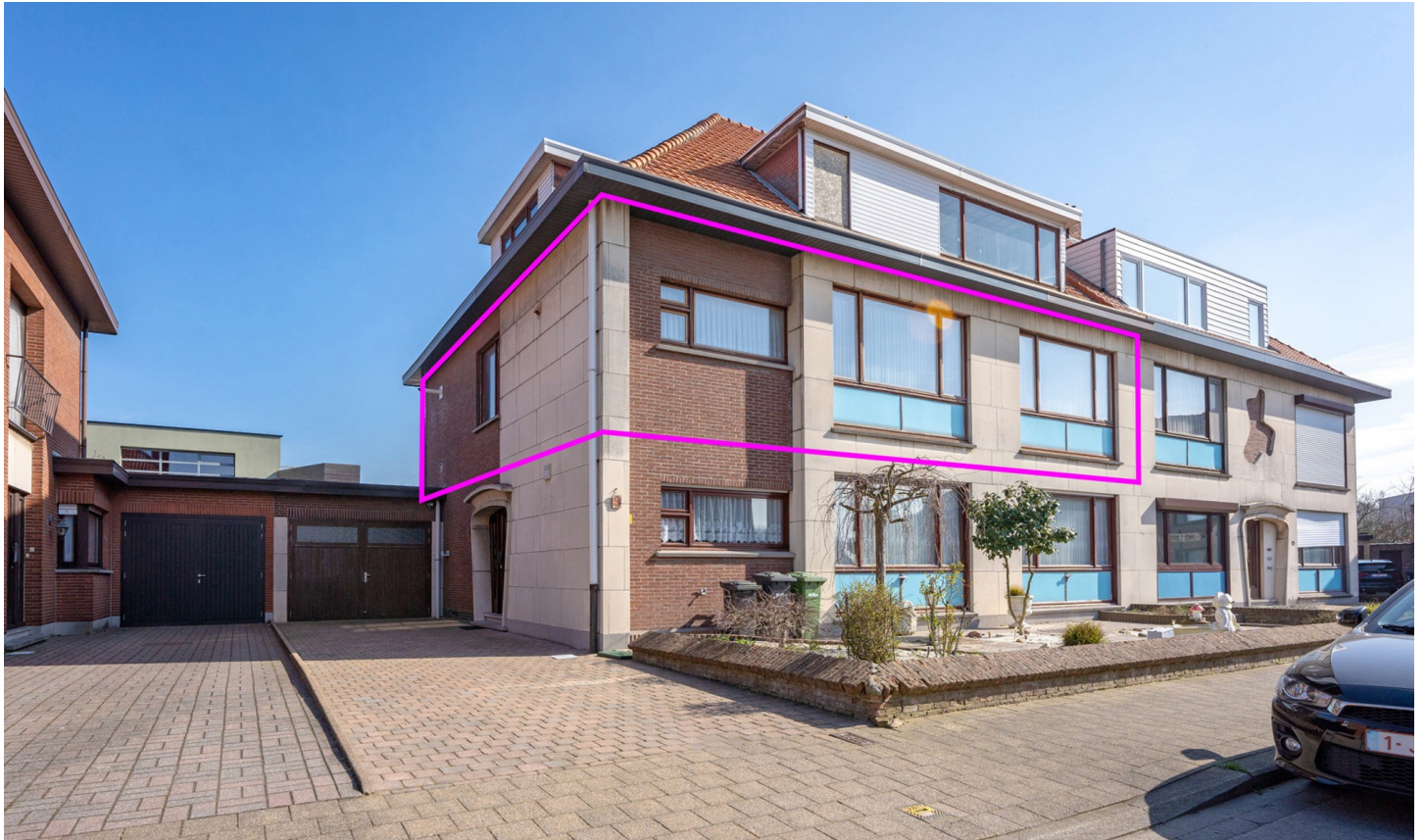
Kapellen | Appartement | € 1.100