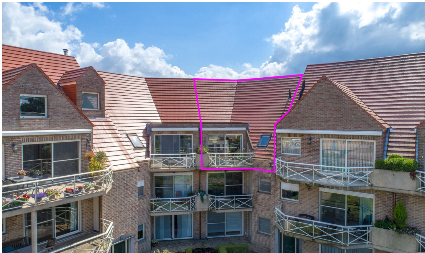
Stabroek | Appartement | € 1.250

Kleine Molenweg 7, 2940 Stabroek | Referentie: 25067-LG-TVDV