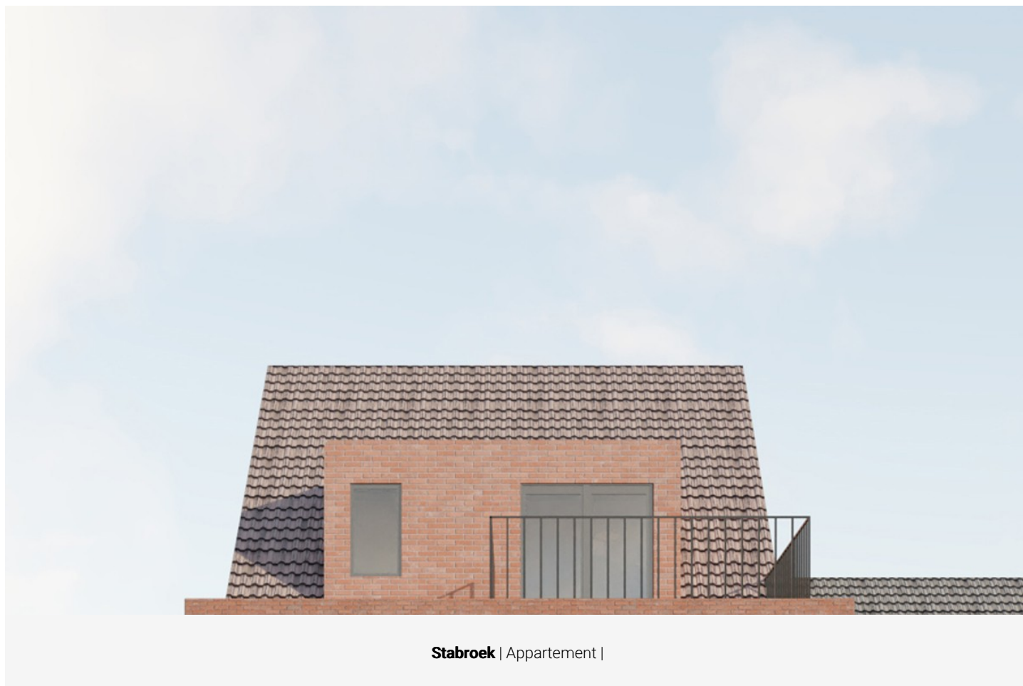
Stabroek | Appartement |

Kleine Molenweg 39, 2940 Stabroek | Referentie: De Kleine Molen-TVDDV-24215