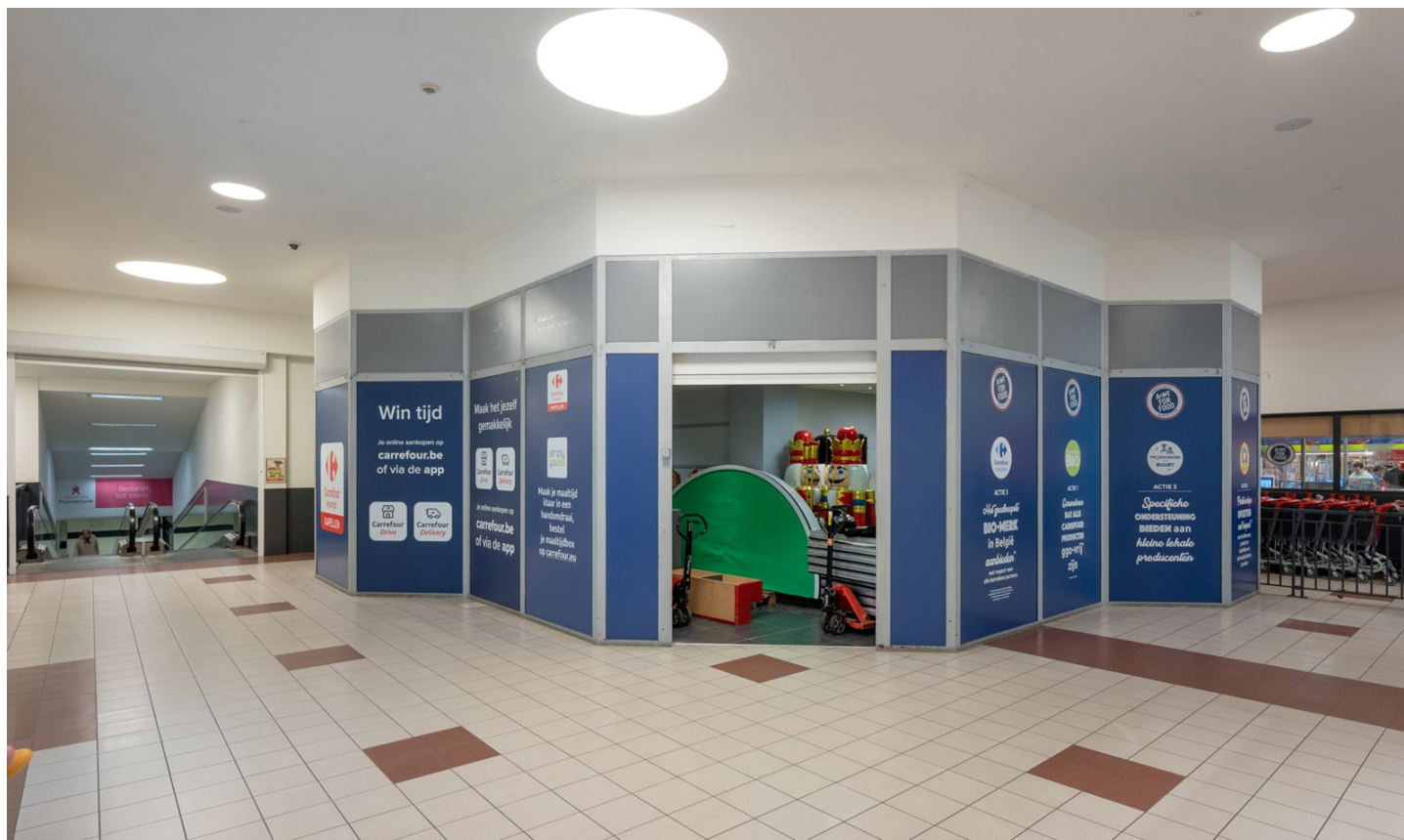
Kapellen | Commercieel | € 1.100

Antwerpsesteenweg 39, 2950 Kapellen | Referentie: 24092-AC